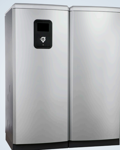
Diplomat Duo Inverter

Thermia Diplomat Duo Inverter on lämpöpumppu erillisellä varaajalla. Tämä on täydellinen kohteisiin, jossa on esimerkiksi suuri käyttövendentarve tai matala huonekorkeus.